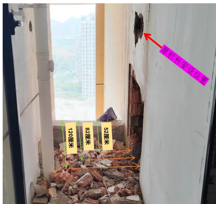
图3 作业处生活阳台