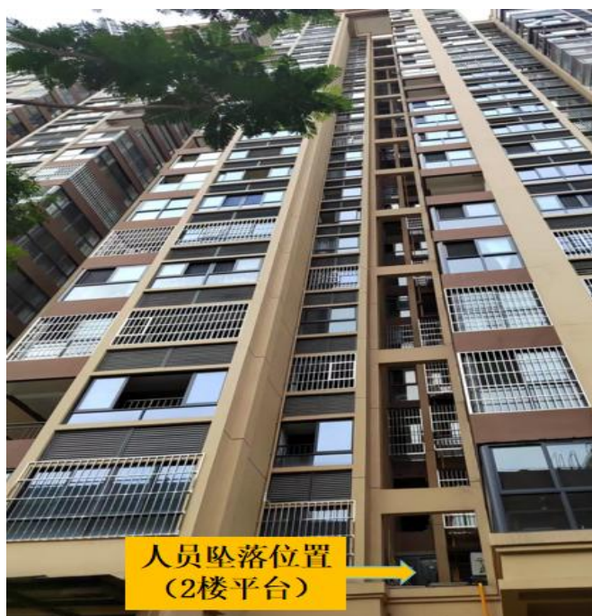
图2 人员坠落位置图